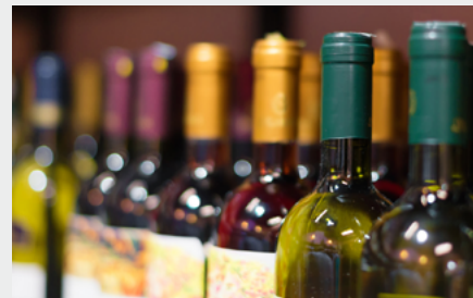
Transporte de vino