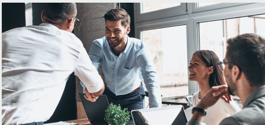
Trabajamos con usted para desarrollar soluciones de transporte personalizadas

Nuestra red mundial y nuestro compromiso garantizan que sus envíos se realicen de forma óptima. Tendemos puentes y abrimos puertas a nuestros clientes.