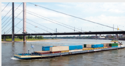
Transporte combinado por carretera y agua

Sin atascos, con muchas menos emisiones que el transporte por carretera y una relación calidad-precio óptima: con el transporte marítimo de corta distancia, sus mercancías viajan de forma económica con un impacto medioambiental mínimo. El transporte marítimo de corta distancia en un solo buque sustituye a unos 130 camiones. Estas salidas están programadas y, por tanto, pueden integrarse de forma óptima en nuestras cadenas de transporte.