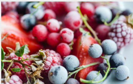
Transporte con control de la temperatura